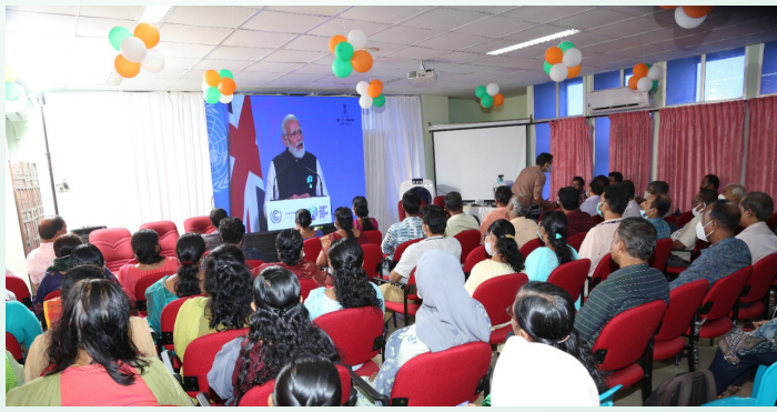
കോഴിക്കോട് വൈദ്യുതവേനം വെള്ളയിലിൽ വച്ചു നടന്ന 'ഉജ്ജ്വല ഭാരതം, ഉജ്ജ്വല ഭാവി, പവർ @ 2047' ഗ്രാന്റ് ഫിനാലെ