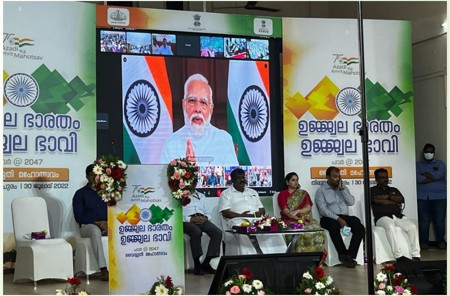
തിരുവനന്തപുരം ഇന്റർസ്റ്റാറ്റ് ഓഫ് എഞ്ചിനീയേഴ്സ് ഹാളിൽ വച്ചു നടന്ന 'ഉജ്ജ്വല ഭാരതം, ഉജ്ജ്വല ഭാവി, പവർ @ 2047' ഗ്രാന്റ് ഫിനാലെ

വീഡിയോ കോൺഫറൻസിൽ വൈദ്യുതിവകുപ്പ് മന്ത്രി ശ്രീ. കെ. കൃഷ്ണൻകുട്ടി പാലക്കാട് കളക്ടറേറ്റിൽ നിന്നും, ഗതാഗതവകുപ്പുമന്ത്രി ശ്രീ ആന്റണി രാജു തിരുവനന്തപുരം ഇന്റർസ്റ്റാറ്റ് ഓഫ് എഞ്ചിനീയേഴ്സ് ഹാളിൽ നിന്നും പങ്കെടുത്തു.